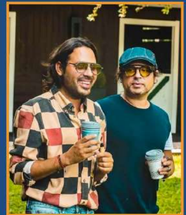
Servando y Florentino hicieron dos exitosos streaming.