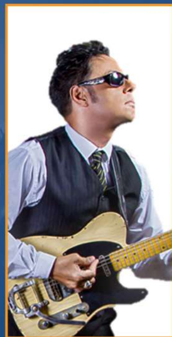
Desorden se presentó en Las Minas de Baruta.

Por eso se espera que 2022 sea más activo en el mundo del espectáculo.